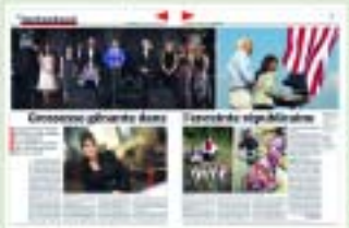
L'actualité de la semaine

Le monde de la politique est en pleine effervescence. Les élections de la semaine prochaine ont été annoncées. Les candidats ont commencé à faire campagne. Les médias ont commencé à parler de la campagne.