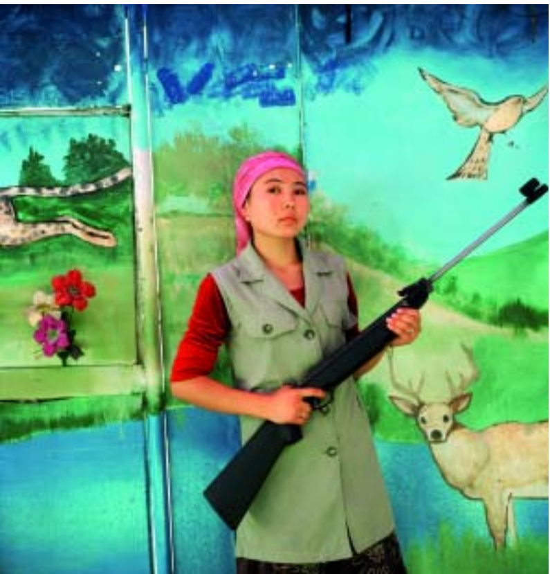
Woman working in a shooting gallery in a park. Osh. Kyrgyzstan, September, 2007