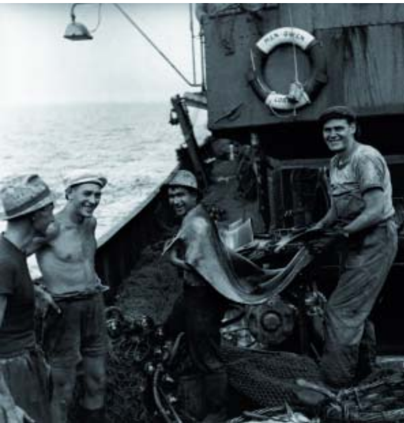
Au large de la Mauritanie abord du chalutier MEN-GWEN - 1942